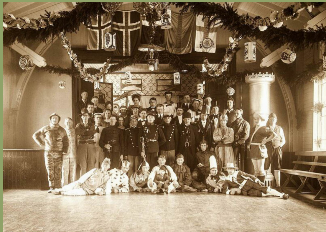
Elevholdet vinteren 1923-24

Vallensgård-bonden havde solgt en tønde land fra til formålet og ved udgangen af marts 1894 havde 87 andelshavere punget ud og købt lodder til 50 kroner stykket. Finansieringsmålet på 10.000 kr. i aktiekapital var nået.