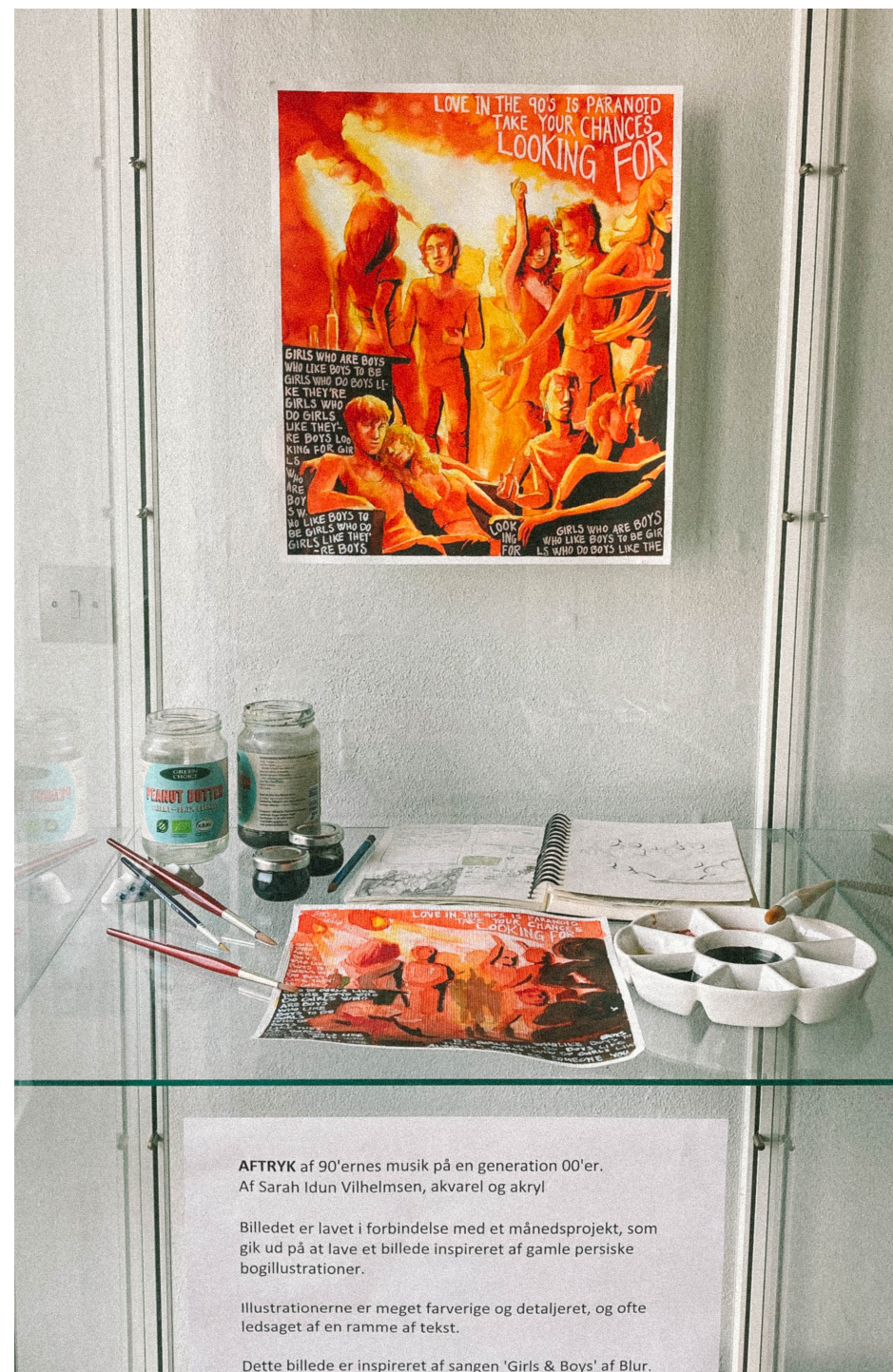
AFTRYK af 90'ernes musik på en generation 00'er. Af Sarah Idun Vilhelmsen, akvarel og akryl

Mit ophold var en kæmpe oplevelse af frihed og åbenhed og kreativitet. Af at kunne prøve nye ting af, og dedikere sig til et fællesskab, hvor alle bare så gerne vil gøre det til den fedest mulige oplevelse. Jeg følte at jeg lærte mig selv meget bedre at kende, og opdagede hvor meget jeg egentlig kan opnå, hvis bare jeg vil det. Alle på mit hold var der til at gribe mig og hinanden i alt, vi gjorde, og det var super selvtilidsskabende at opleve.