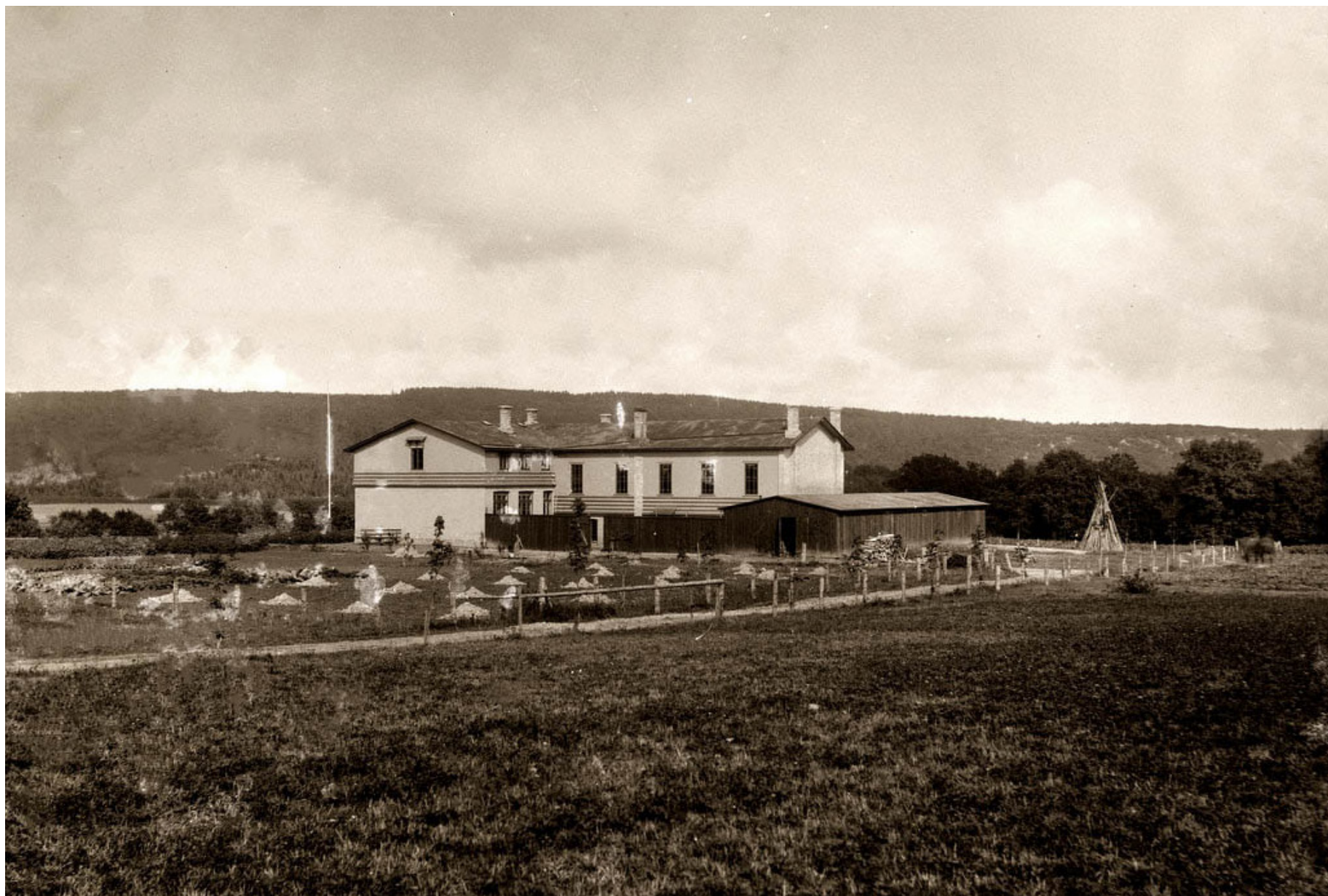
Bornholms Højskole 1897