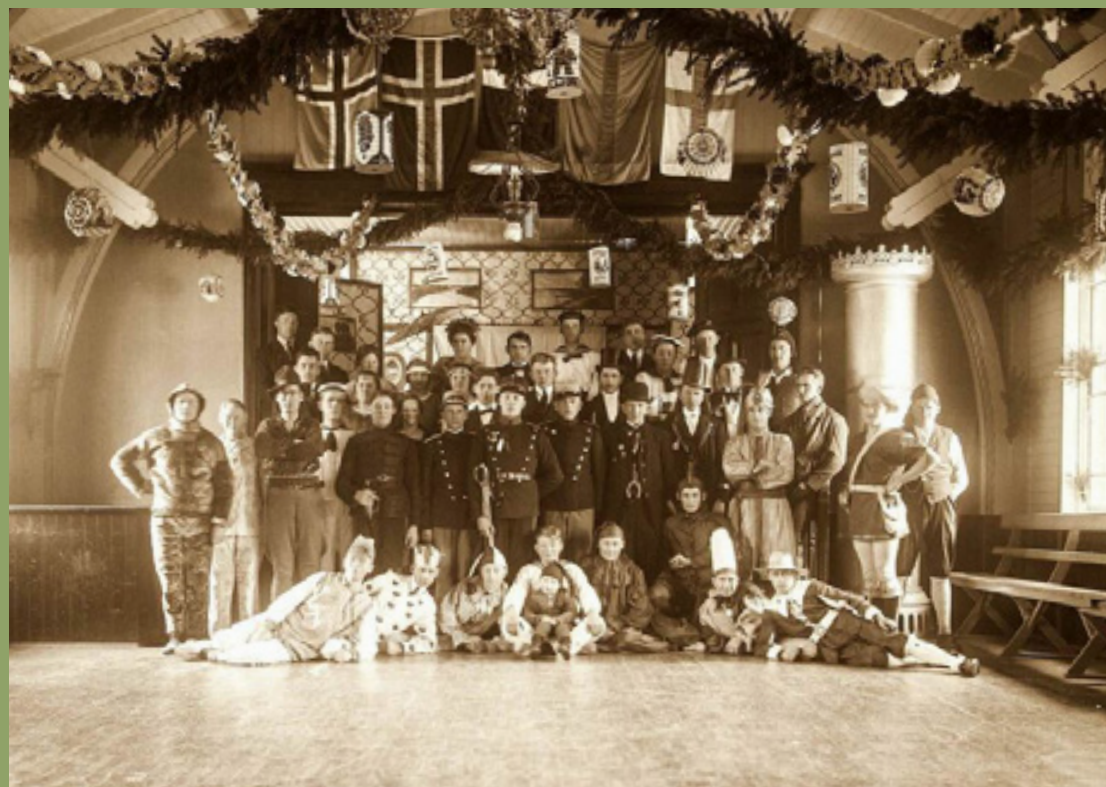
Elevholdet vinteren 1923-24

Vallensgård-bonden havde solgt en tønde land fra til formålet og ved udgangen af marts 1894 havde 87 andelshavere punget ud og købt lodder til 50 kroner stykket. Finansieringsmålet på 10.000 kr. i aktiekapital var nået.