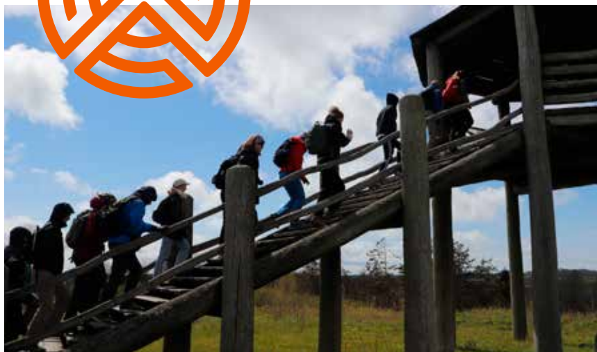
Den fantastiske natur som omgiver skolen, bliver benyttet flittigt både i og uden for undervisningen