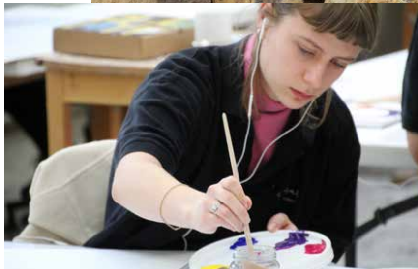
Eleverne på skolen har mulighed for at udfordre sig selv på flere forskellige måder

fået mulighed for at opgradere udstyr og inventar, så skolen fremstår indbydende, spændende og hyggelig for eleverne og kursisterne.