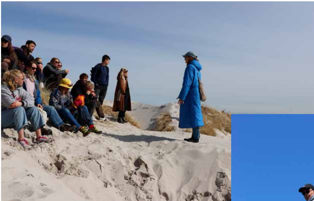
I faget 'Os i naturen' er skolens elever på ture rundt på øen og hører om dens sagn og historie